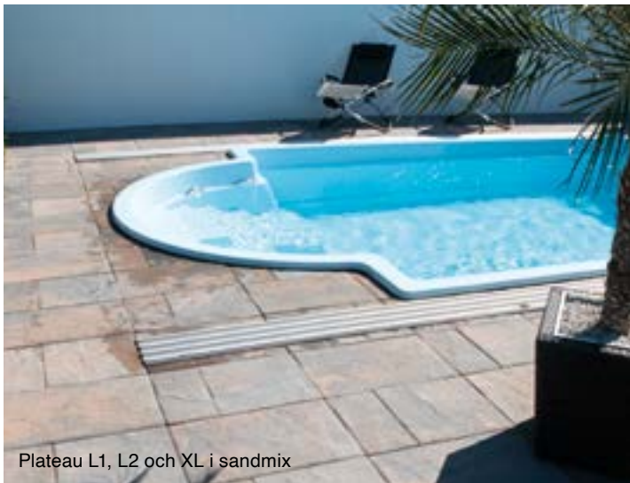
Plateau L1, L2 och XL i sandmix