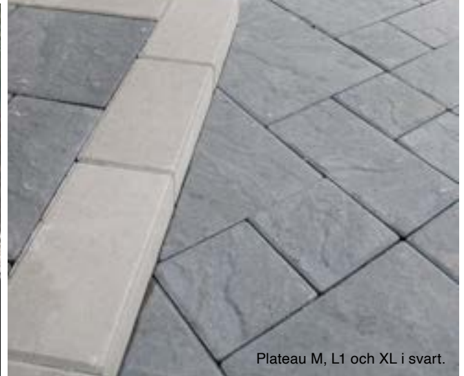
Plateau M, L1 och XL i svart.