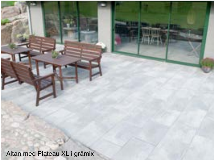
Altan med Plateau XL i gråmix