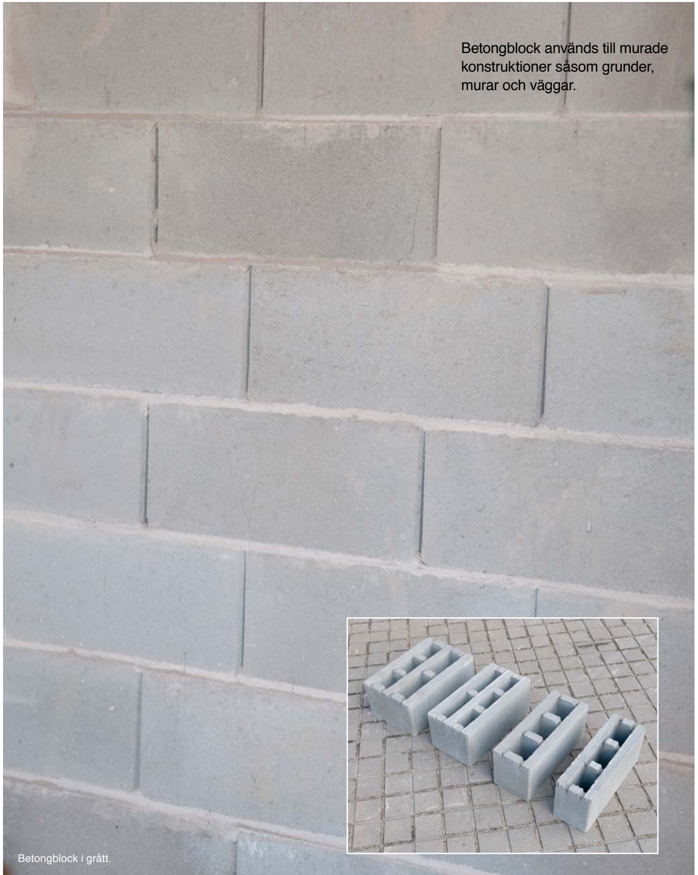
Betongblock i grått.

Betongblock används till murade konstruktioner såsom grunder, murar och väggar.