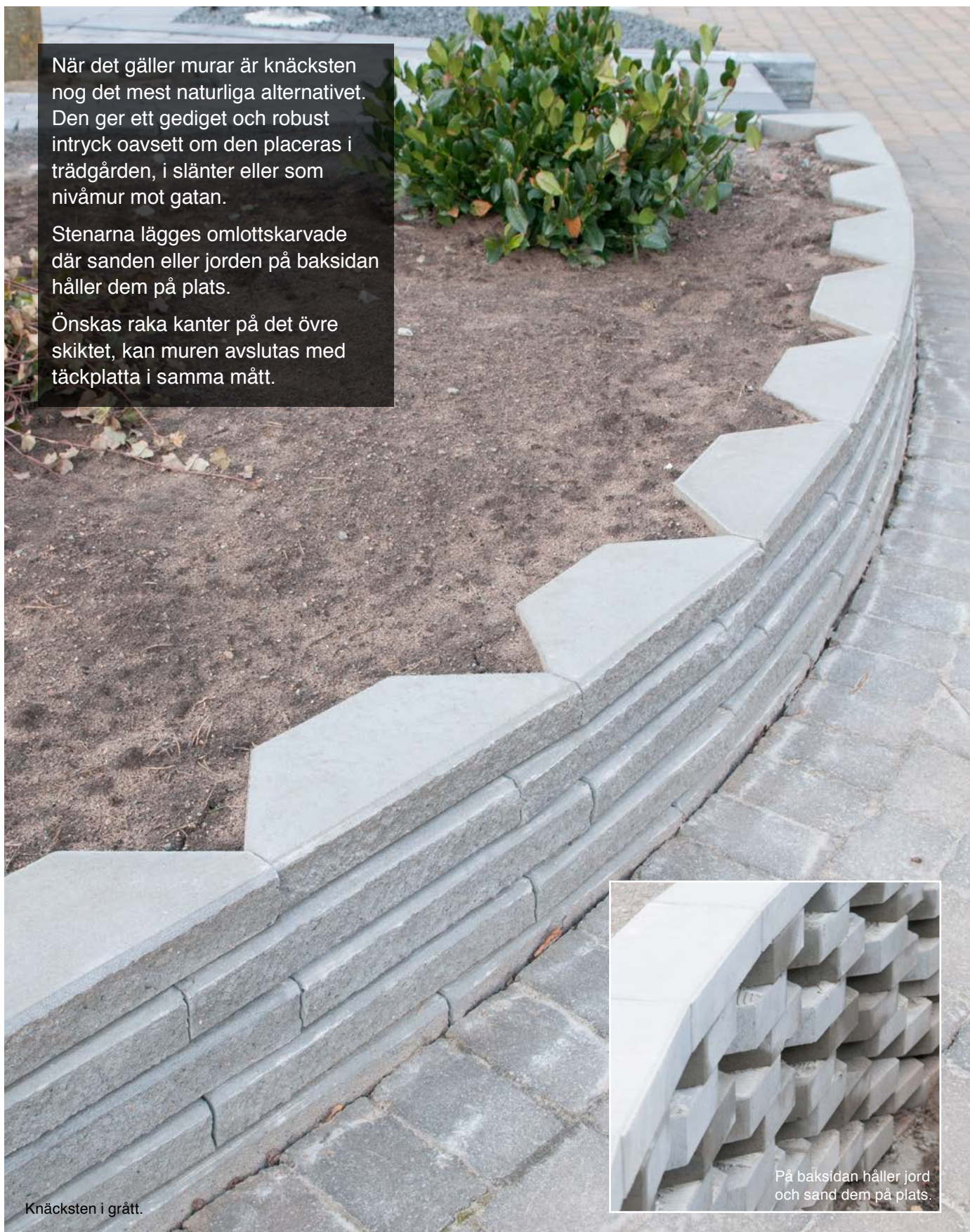
Knäcksten i grått.

Önskas raka kanter på det övre skiktet, kan muren avslutas med täckplatta i samma mått.