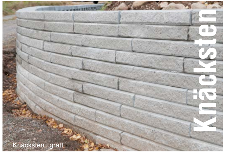
Knäcksten i grått.