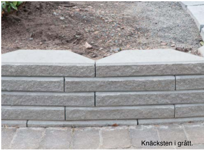
Knäcksten i grått.