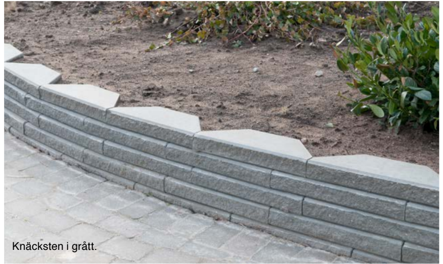
Knäcksten i grått.