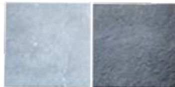
Obehandlad Behandlad med coating GF