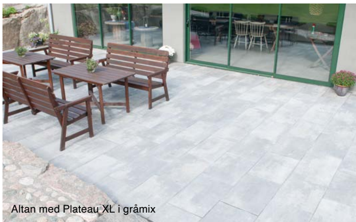
Altan med Plateau XL i gråmix