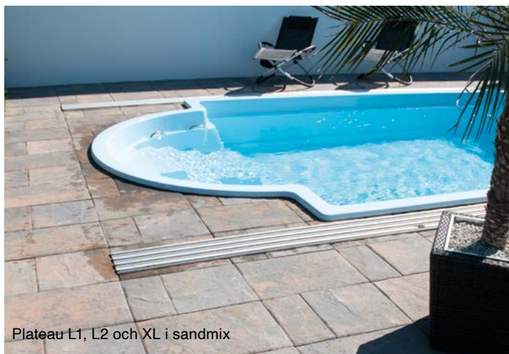
Plateau L1, L2 och XL i sandmix